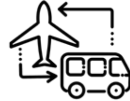
TRANSFERURI DE LA ȘI CĂTRE AEROPORT