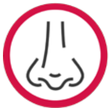
CHIRURGIE ESTETICĂ, PLASTICĂ ȘI RECONSTRUCTIVĂ