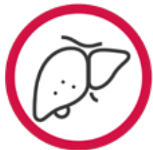
TRANSPLANT DE FICAT