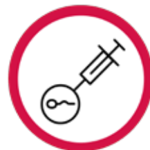
FIV – FERTILIZARE IN VITRO