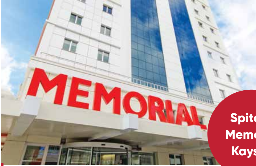
Spitalul Memorial Kayseri