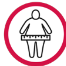
CHIRURGIE PENTRU OBEZITATE