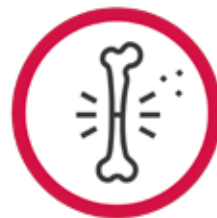
TRANSPLANT DE MĂDUVĂ OSOASĂ