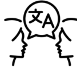
SERVICII DE TRADUCERE ÎN LIMBA MATERNĂ