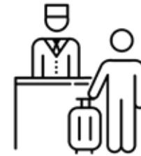
REZERVĂRI DE HOTEL