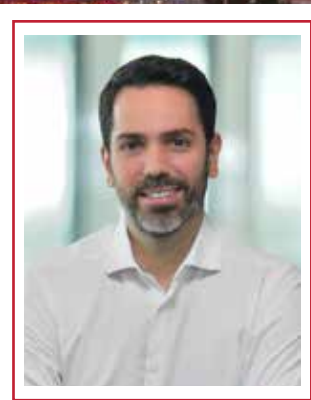
Bora ULUDÜZ Director - General

"Grupul Memorial Healthcare își reafirmă angajamentul față de cele mai înalte standarde de excelență și calitate în serviciile medicale. Folosim tehnologie de top și ne ghidăm după valori puternice și principii etice bine definite, punând mereu pacientul pe primul loc, pentru a oferi îngrijire medicală la cel mai înalt nivel"