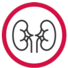
TRANSPLANT DE RINICHI